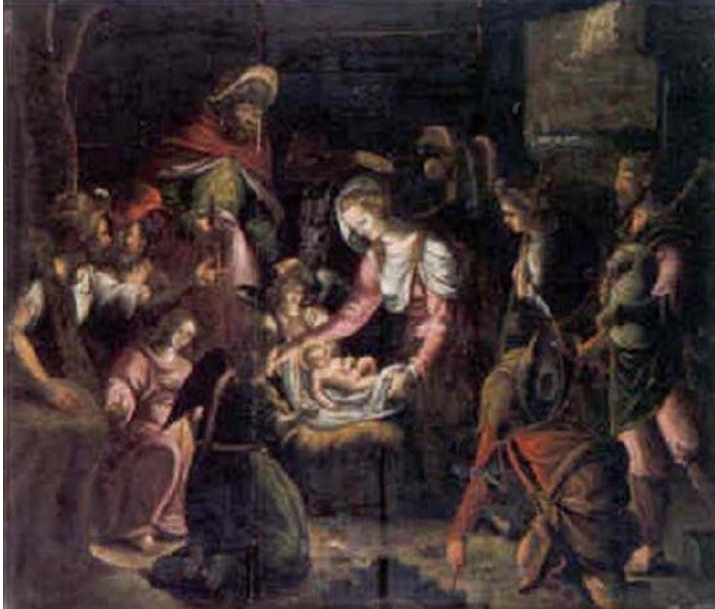
La naissance du Christ, école française, 1675-1699, huile sur toile.

Bulletin d'information No 5/19 du 1.12. au 31.1.2020