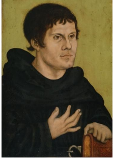
Martin Luther, par L. Cranach l'ancien, env. 1523

Bulletin d'information No 4/20 du 1.10. au 30.11.2020