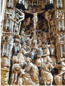
Retable de Fromentières (Marne), école Flamande, XVIe. Détail, La crucifixion.

Bulletin d'information No 1/20 du 1 février au 30 avril 2020