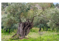
Table d'hôtes l' « Olivier »

La Commission de diaconie propose aux aînés un ou deux repas chez un hôte. Un service de transport sera organisé. L'idée est de donner à chacun