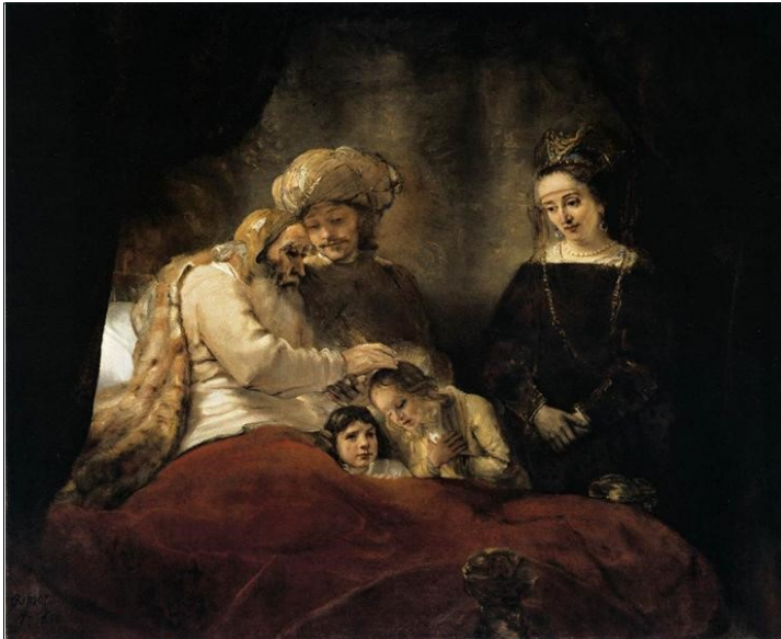
La bénédiction des fils de Joseph par Jacob, Rembrandt, 1656

Bulletin d'information No 5/21 du 1.10 au 30.11. 2021